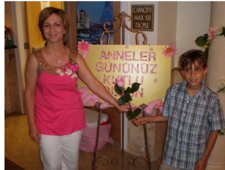
Anneler Günü -2010