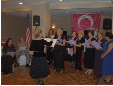
Cumhuriyet Bayramı Balosu-2009