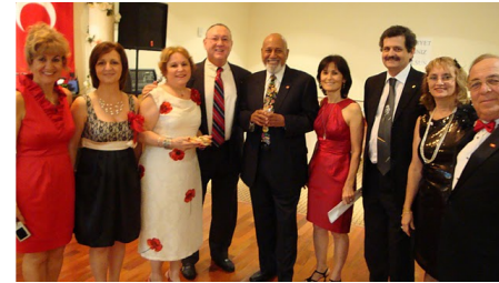
Cumhuriyet Bayramı Balosu-2010 Guest: Hon. Rep. Alcee Hastings with FTAA and FTCF directors