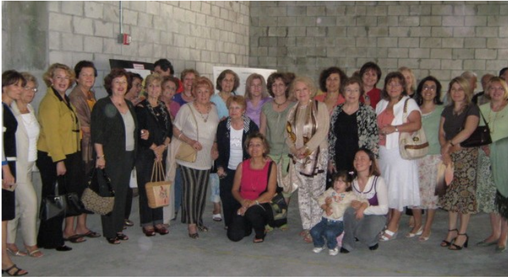
FTAA members who were anxious to have TÜRKEVİ completed. They frequently visited TÜRKEVİ even before construction started. 2009