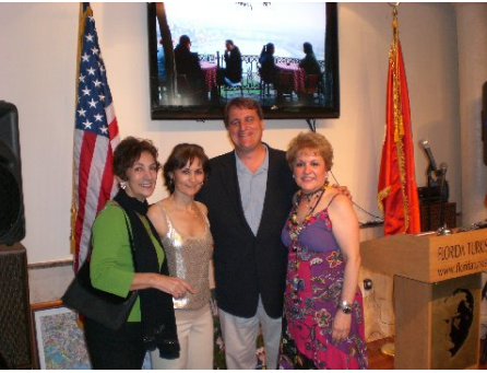
Fort Lauderdale Mayor Bober visited Türk Evi in the event "Istanbul, Cultural Capital-2010"