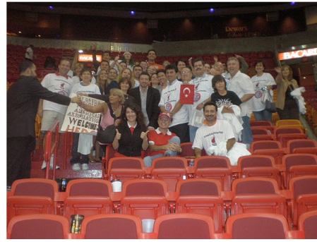
Hedo Turkish Heritage Day-2009