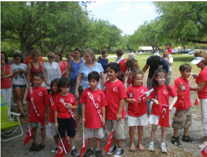
The children of Atatürk School, showed a great progress just in one school year.