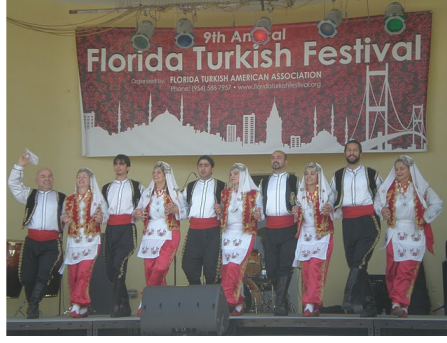
Turkish Festival at Hollywood Beach-2010