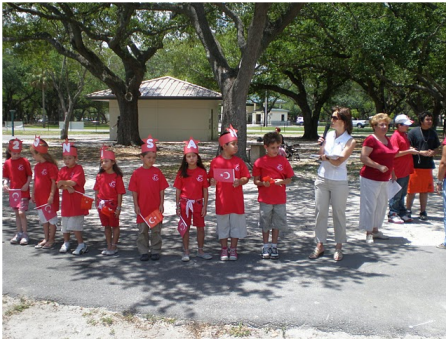
23 Nisan Egemenlik ve Çocuk Bayramı Pikniği