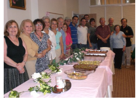
Routine Wednesday Dinners by talented Turkish ladies