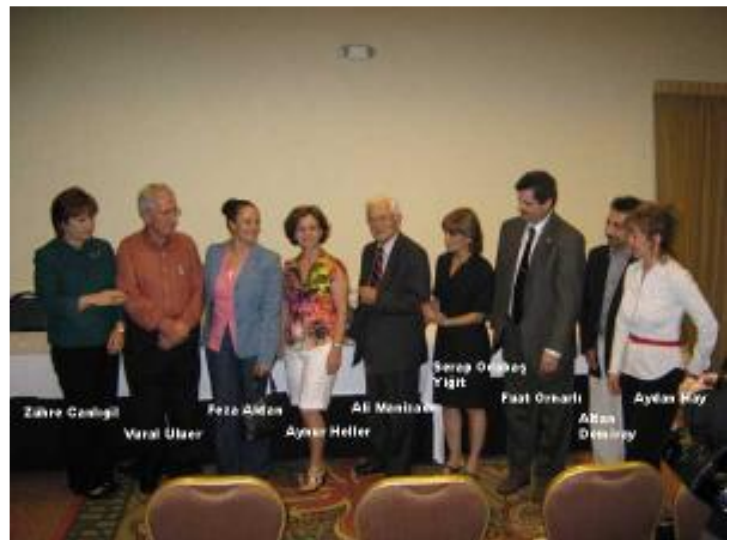
2009-2010 Dönemi Yönetim Kurulu üyelerine tüm özverili hizmetleri için teşekkür ederiz

www.ftaa.com web sitemizi ziyaret ettinizmi? Orada tüm etkinliklerin detaylarını bulacaksınız