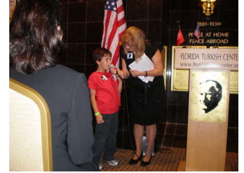
Atatürk'ü Anma Günü-2010