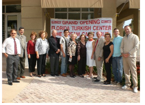
Türk Evi Açılış-2009