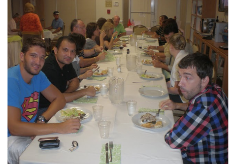
Iftar Yemekleri -2010