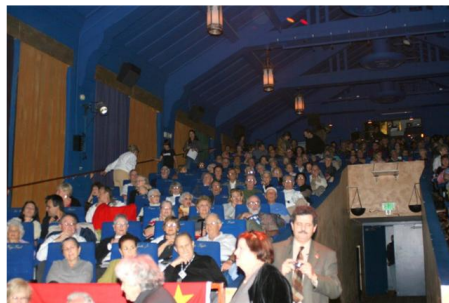
Turkish Film presentation in Paradiso in Fort Lauderdale- 2010, Visitor found a chance to taste Turkish food prior to film.

Thanks to the valuable couple visiting us from Mashantucket, CT