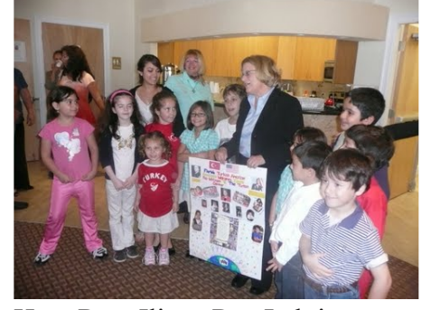
Hon. Rep. Iliana Ros Lehtinen visited Türk Evi -2010