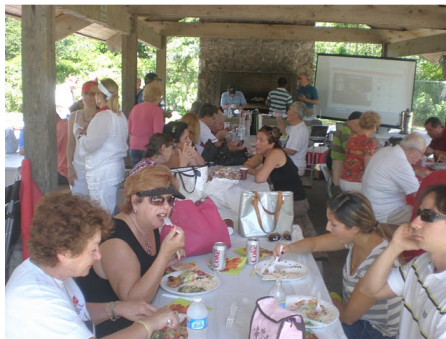
Ramazan Bayramı Piknik-2010"