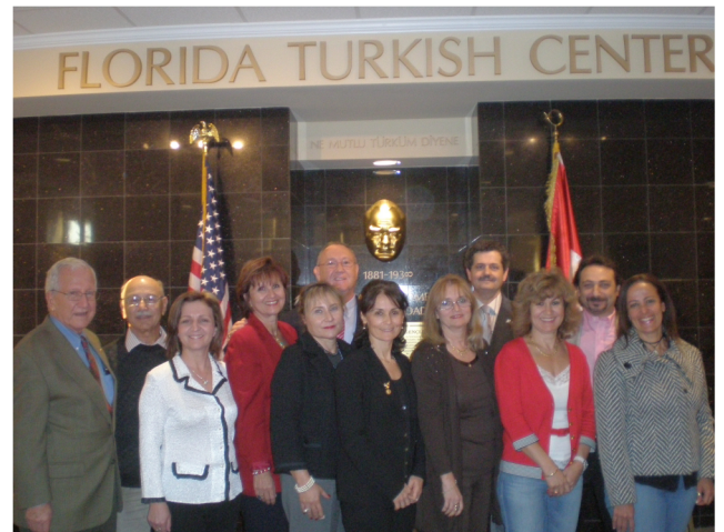
It took six months to finalize the drawings, first for three bays, then re-revised for the whole lot. The construction took another 5 months. It was ready as of Nov.2009 for Ataturk commomerating Day. We arranged Open House receptions to let our members to visit.