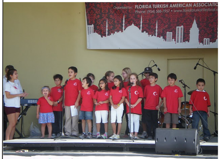
The children of Atatürk School, took a stage in the festival, and song a series of children songs.