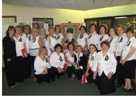
Atatürk Anma Günü-2009