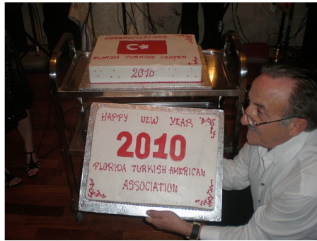
New Year Ball-2010