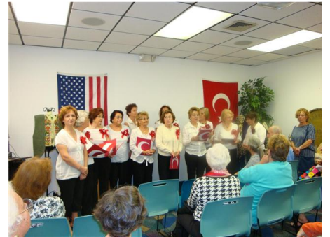
Turkish Culture presentation at the Fort Lauderdale library-2010 Turkish Choirs is at the work