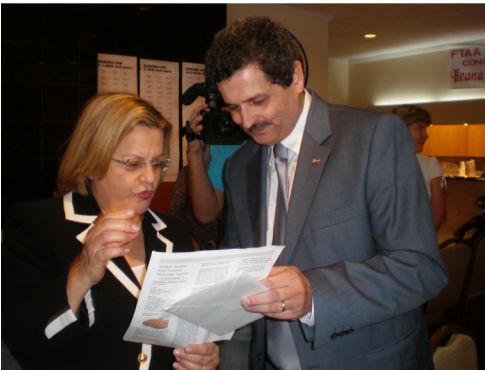
Ileana Ros-Lehtinen has Turkish roots. Her great grandfathers were migrated to Edirne from Spain.

It was a tremendous opportunity for us to exposure of Turkish Center(FTCF) and our association(FTAA) to the public.